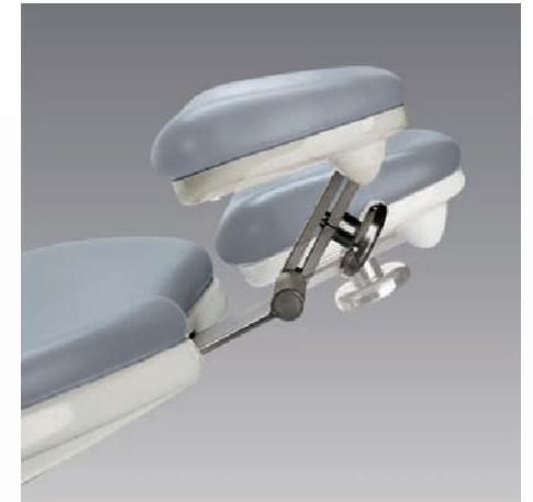
REPOSACABEZAS DOBLE ARTICULADO AJUSTABLE

El reposacabezas ajustable de doble articulación permite un posicionamiento de la cabeza cómodo y sin esfuerzo: sin compresión del diafragma ni flujo sanguíneo excesivo a la cabeza.