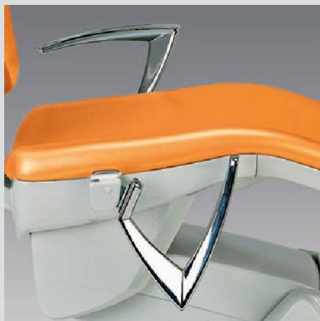
REPOSABRAZOS DERECHO MOVIL (OPCIONAL)