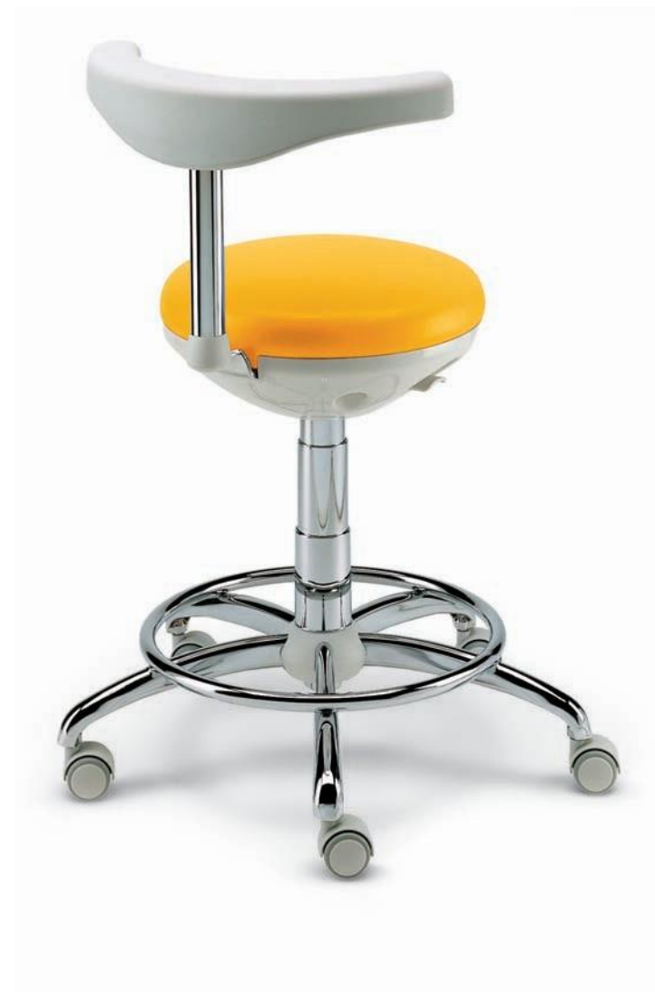
ASSIST Taburete auxiliar anatómico